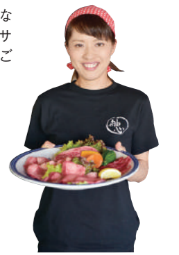
お肉はもちろん、大根がたっぷり乗ったピリ辛味の「軸心サラダ(745円)」もおすすりめ。自家製ドレッシングも評判です!

矢板市中2006-1 ☎0287-44-3777 🕒AM11:00~PM2:00、PM5:00~PM10:30 📅月曜 🍷20台 📍P15 C-2