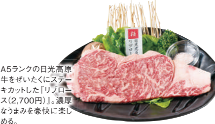
A5ランクの日光高原牛をぜいたくにステーキカットした「リブロース(2,700円)」」。濃厚なうまみを豪快に楽しめる。

矢板市乙畑1626-2 ☎0287-48-2411 🕒PM5:00~PM9:30(L.O.) 📅月曜(祝日の場合は営業) 🍷12台 📍P14 C-4