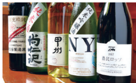
矢板市「森戸酒造」の純米吟醸酒や、那須塩原市「渡邊葡萄酒醸造」のNASU WINEなど、県内のさまざまなお酒を取り揃える。