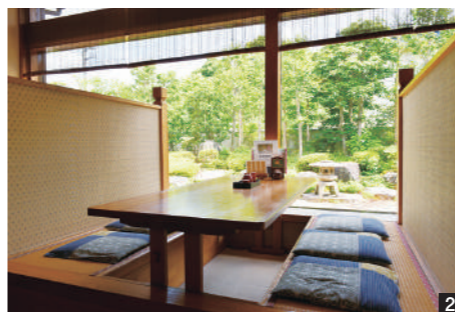
1. ミニそば、とろろ、まごはん、マグロの刺身、小鉢がセットの「まごはん(1,480円)」も人気メニュー。2. 各テーブル席からは中庭を眺めることができる。店内は広く多人数でも安心。