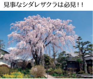
見事なシダレサクラは必見!!