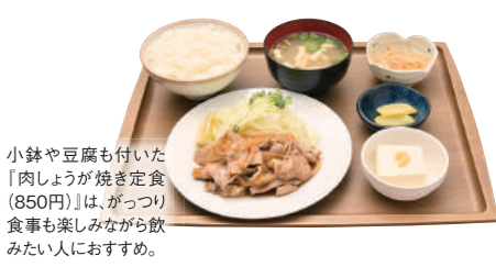
小鉢や豆腐も付いた「肉しょうが焼き定食(850円)」は、がっつり食事を楽しみながら飲みたい人におすすめ。

矢板市片岡2173-2 ☎0287-48-0251 🕒AM10:30~PM10:00(L.O./PM9:30) 📅お盆・年始 🍷30台 📍P14 C-4