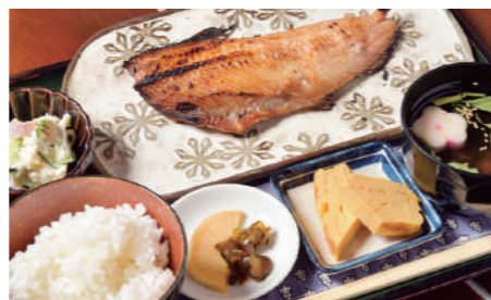
ランチで人気の「焼魚定食(900円)」。ほかにも「焼鳥丼」や「牛すじ煮込み定食」など、お得なランチ定食は10種類と充実。