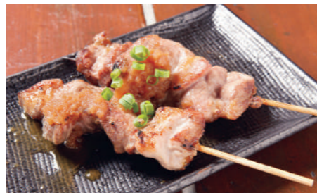
やわらかく、うまみたっぷりの「ヤシオポーク 2本(480円)」。肉の甘みにマッチする特製ソースでさっぱりと味わえる。