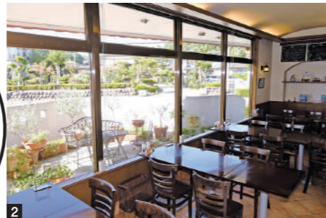
1. 薪窯でふっくらと焼き上げられた熱々の焼きたては、食感も風味も格別。さまざまな味をシェアして楽しむのもおすすめ。 2. 大きな窓から光が差し込む明るい店内は、居心地も抜群。