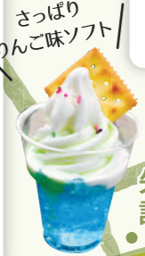
さっぱりりんご味ソフト

矢板市矢板114-1 ☎0287-40-0978 ①軽食 AM9:00~PM5:00 食事 AM11:00~PM4:00 食事のみ (L.O./PM3:45) Ⓜ不定休 Ⓜ有り 📍P15 A-2