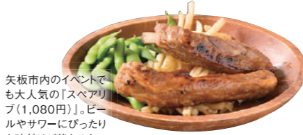
矢板市内のイベントでも大人気の「スベアリア」(1,080円)」。ビールやサワーにぴったりな味付けが後をひく。

矢板市扇町2-2-1 三星マンション2F ☎0287-46-5270 🕒PM5:00~深夜0:00 📅日・月曜※予約応相談 🍷10台 📍P15 B-2