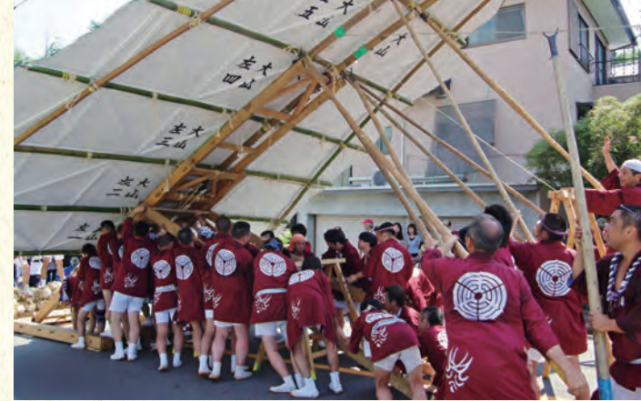
大山を上げる若衆たち