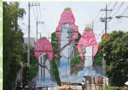
烏山和紙で作られたはりか山。 手前から 前山…高さ約5m 中山…高さ約7m 大山…高さ約10m