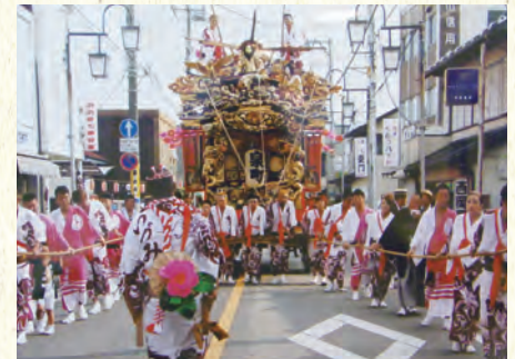
彫刻も美しい大屋台(山車)

460年以上の歴史を誇る、絢爛豪華な野外劇。 観客の前に、道路上100mにも及ぶ舞台が設置されます。 烏山和紙を使った背景の「はりか山」(大山、中山、前山)や館、橋、波などが配置され、舞台の進行に伴い様々な変化します。 若衆達の糸乱れぬ妙技と、踊り娘達の常磐津の三味線にあわせた美しい舞は、一見の価値あり！ 毎年7月の第4土曜日を含む金、土、日に開催されます。