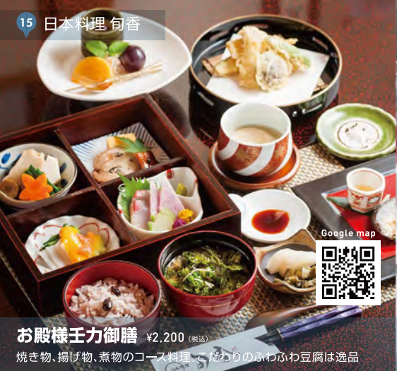
15 日本料理 匂香