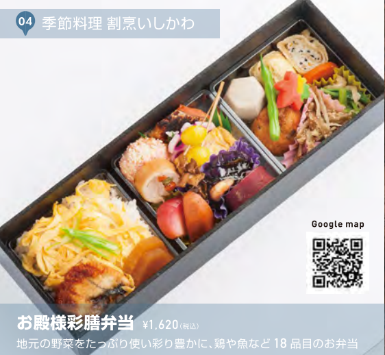
04 季節料理 割烹いしかわ