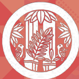
壬生藩の家紋「鳥居笹」

壬生お殿様料理促進の会 事務局／壬生町商工観光課観光交流係 Tel:0282-81-1844 / Fax:0282-82-1107 〒321-0292 栃木県下都賀郡壬生町通町12番22号