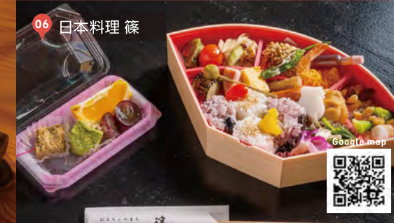
06 日本料理 篠

あんみつ姫セット ¥1,430 (税込) そば粉を使った寒天入りのあんみつがこだわりのざるそば膳