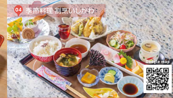
04 季節料理 割烹いしかわ

お姫様ちらし ¥1,800 (税込) 栃木産の漢熟米やかんぴょうなど地元素材を活かしたちらし寿司