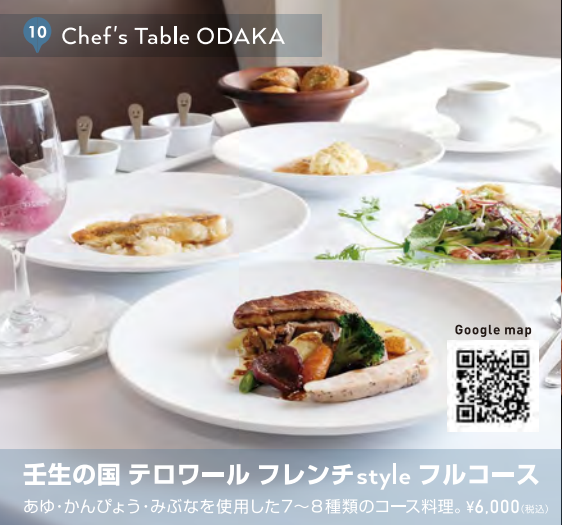
10 Chef's Table ODAKA