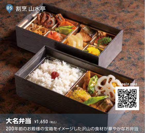
05 割烹 山水亭