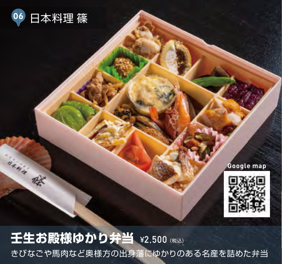
06 日本料理 篠