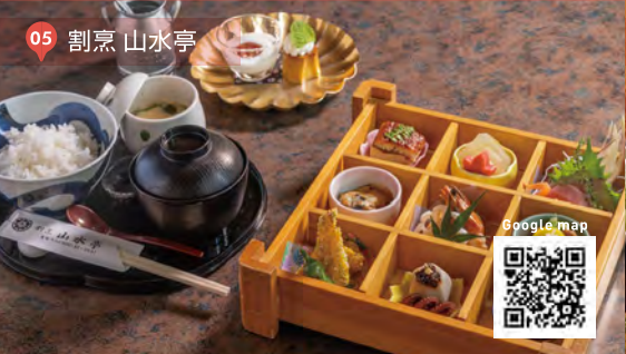
05 割烹 山水亭

プリンセス アラモード ¥1,000 (税込) 手づくりのプリンと旬のデザートのをせた、プチ贅沢なデザート