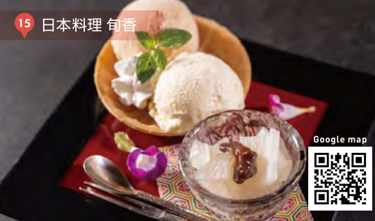
15 日本料理 旬香

ALOCOMOCO ¥1,380 (税込) 栄養価の高い藍の種パウダーや漢方卵を使用したロコモコ丼