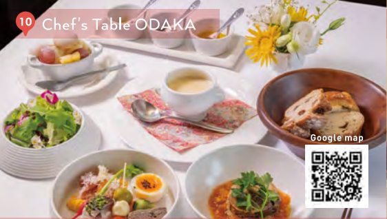
10 Chef's Table ODAKA

※予約なく、ご利用いただけます。 ※季節により材料が変わる場合がございます。ご了承ください。