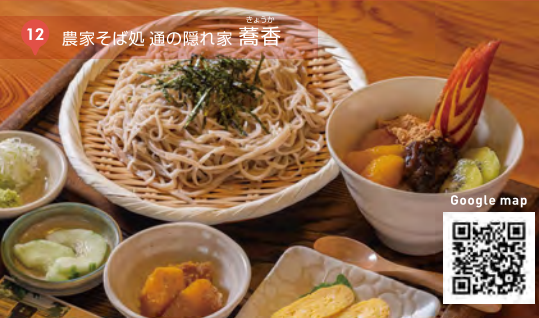
12 農家そば処 道の隠れ家 蕎香

壬生お姫様御膳 ¥1,400 (税込) 当時の献立を鮮やかな見た目にアレンジ。女性におすすめのメニュー