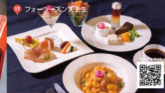
17 フォーシーズンズ壬生

壬生の春めく玉手箱 ¥2,860 (税込) 器を開けると色とりどりの食材が並び、まるで玉手箱のような御膳