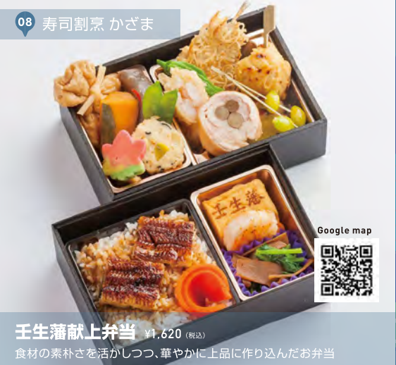
08 寿司割烹 かざま