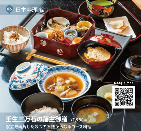
06 日本料理 篠

※ご利用には事前予約が必要です。ご予約の上お越しください。 ※季節により材料が変わる場合がございます。ご了承ください。