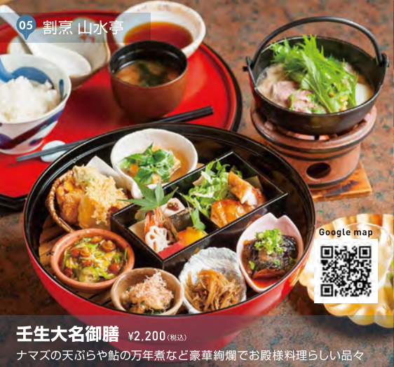
05 割烹 山水亭