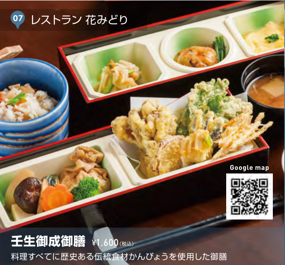
07 レストラン 花みどり