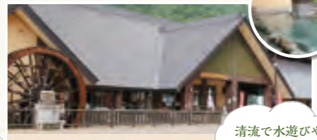
清流で水遊びや散策、温泉入浴も

源泉かけ流し温泉や岩盤浴、足湯が楽しめます。食堂ではダムカレーや地粉そば、ばんだいもちが人気。宿泊案内や水陸両用バスもここで。