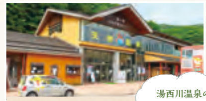
湯西川温泉の玄関口の道の駅

部落の守護仏として長く信仰されていました。33体の観音様を一堂内にまつてあります。