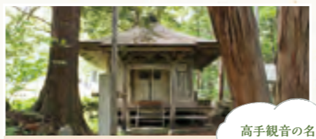
高手観音の名で知られる