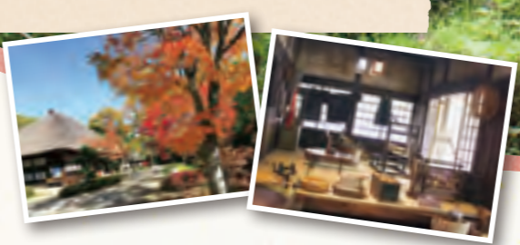
湯西川温泉のルーツを垣間見る空間

平家の人々の生活様式を後世に残すため、村内の茅葺き屋根の民家を移築し再現した民俗村。