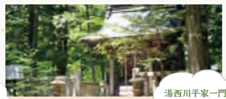
湯西川平家一門の守護神

平家の里前の森林公園内にそびえる大木。平家の人々が湯西川を安住の地と定めたときの記念樹と伝えられています。