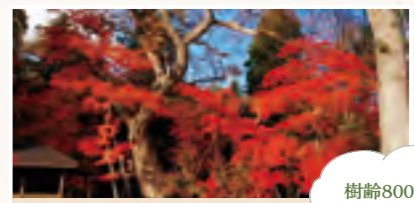
樹齢800年の栗の大木

平家の子孫が、河原に見つけ傷を癒したと伝えられる歴史の古い温泉。湯西川の渓谷沿いに旅館や民家が立ち並びます。