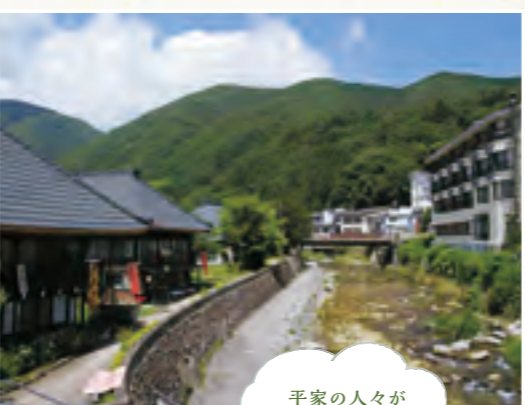
平家の人々が愛した湯と山河

平家伝説が残る湯西川の名物。川魚、鹿肉などをいろいろ端で焼いて食べる野趣豊かな郷土料理。各旅館などで食べられます。