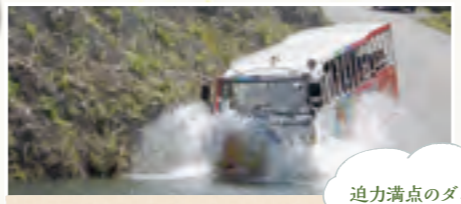
迫力満点のダム湖クルージング

源泉かけ流し露天風呂や足湯などが人気の観光センター。清流沿いには大吊り橋や遊歩道が整備され、観光農園や湯西川くらし館なども併設。そば打ち体験もできます。