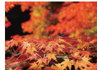
春:梨の花 夏:ホタル 秋:そばの花 晩秋:紅葉