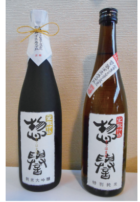
そうほまれ 市貝の地酒「惣譽」