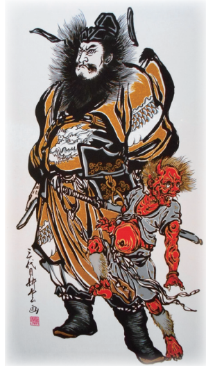
「栃木県指定無形文化財」三代目 大畑耕雲画

健やかな成長と立身出世を願って立てられる 歴史上の武将が描かれた 武者絵 のぼり旗。 今にも飛び出してきそうな迫力ある郷土の伝統工芸品。