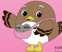
市貝町マスコットキャラクター 「サシバのサツちゃん」

私たち「サシバ」が 安心して暮らせる日本の 美しい原風景… 本物の『里山』がここには あります。 四季折々の『市貝』を ぜひ訪ねてみて ください。