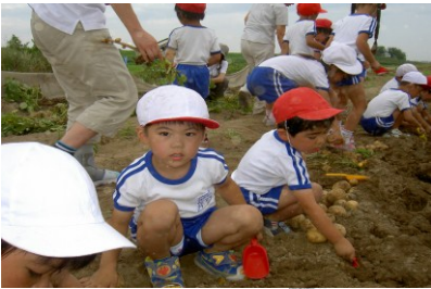
〔じゃがいも掘り体験〕