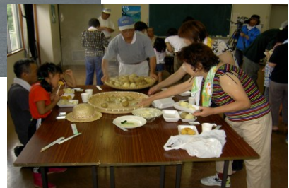
〔じゃがいも試食会〕