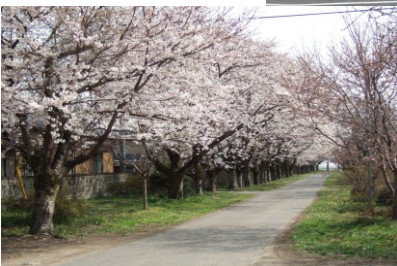
〔上梁八幡宮の桜並木〕