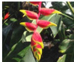
ヘリコニアロストラータ