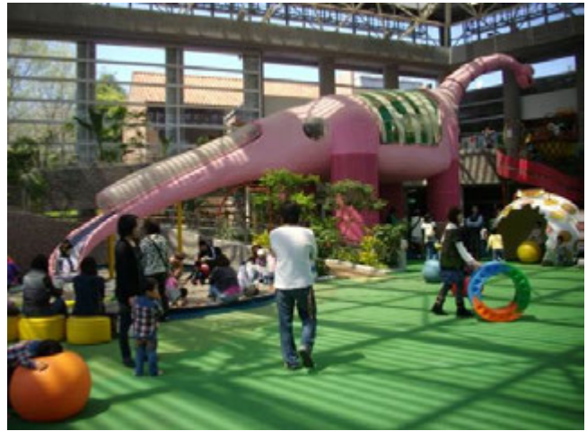
雨天でも安心♪屋内施設『こどもの城』

とちぎわんぱく公園は、日常では経験できない体験メニューなど、お子さんから大人の方まで楽しめるイベントが盛りだくさんです。また、 ムシが集まる木をさがしてみよう や ブルーベリーを摘もう など『自然』と『季節』を体で感じる様々なイベントを開催します。是非とちぎわんぱく公園にお越しください。