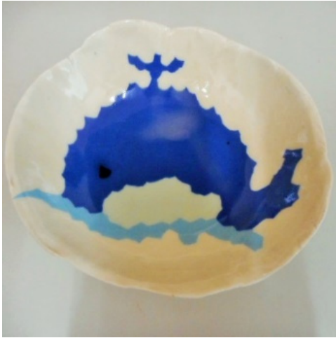
親子で『アイス皿』をつくろう