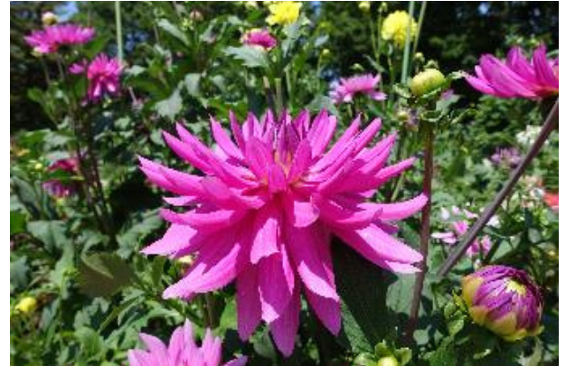
季節の草花が楽しめる夢花壇

とちぎわんぱく公園内にあるメイン花壇『夢花壇』が夏バージョンになりました。6月から9月にかけて、ダリア・ジニア・サルビアや宿根草など、 約60種類 の夏の草花が次々と見ごろを迎えます。色鮮やかな花々をお楽しみください。