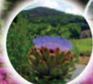
アーティチョーク