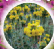
エルサレムセージ