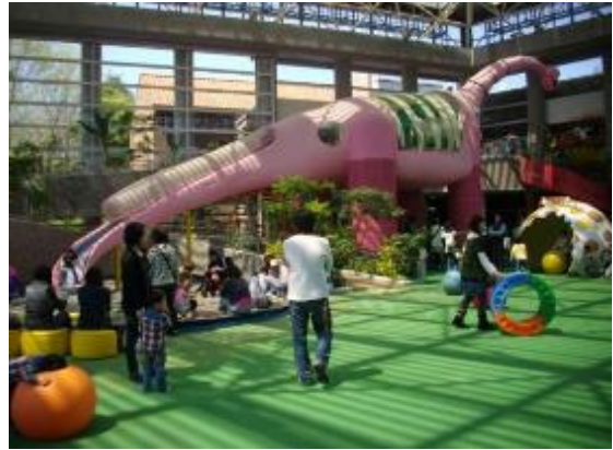
雨天でも安心♪屋内施設『こどもの城』

とちぎわんぱく公園は日常では経験できない体験メニューなど、お子さんから大人の方まで楽しめるイベントが盛りだくさんです。また、 とちぎ県民クイズラリー や オオムラサキの放蝶会 など、『自然』と『季節』を体で感じる様々なイベントを開催します。是非とちぎわんぱく公園にお越しください。