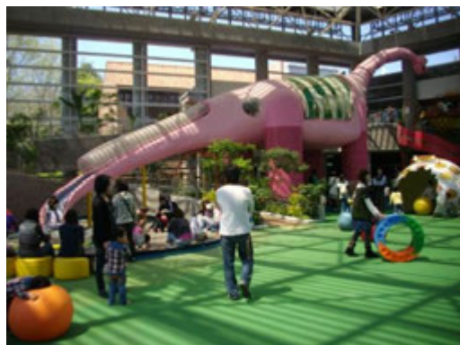
雨天でも安心♪屋内施設『こどもの城』

とちぎわんぱく公園は、日常では経験できない体験メニューなど、お子さんから大人の方まで楽しめるイベントが盛りだくさんです。また、 かかしまつり や ヤギのえさやり体験 など『 自然 』と『 季節 』を体で感じる様々なイベントを開催します。ぜひ、とちぎわんぱく公園にお越しください。