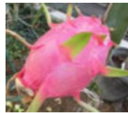
ドラゴンフルーツ