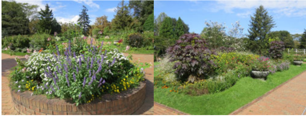
季節の草花が楽しめる夢花壇 ※2020年9月撮影

とちぎわんぱく公園内にあるメイン花壇『夢花壇』が夏バージョンになりました。6月から9月にかけて、ダリア・シニア・サルビアや宿根草など、約60種類の夏の草花が次々と見ごろを迎えます。色鮮やかな花々をお楽しみください。