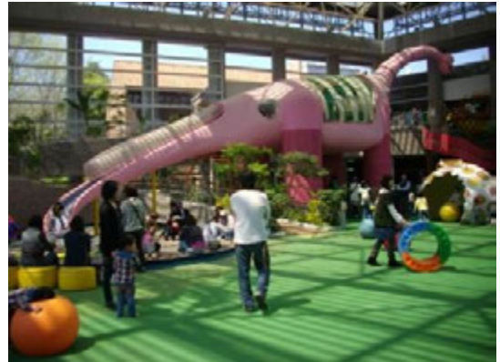
雨天でも安心♪屋内施設『こどもの城』

とちぎわんぱく公園は、日常では経験できない体験メニューなど、お子さんから大人の方まで楽しめるイベントが盛りだくさんです。また、 七夕～旧暦～短冊をかざろう や ブルーベリーを摘もう など『自然』と『季節』を体で感じる様々なイベントを開催します。是非とちぎわんぱく公園にお越しください。