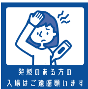
発熱のある方の 入場はご遠慮願います