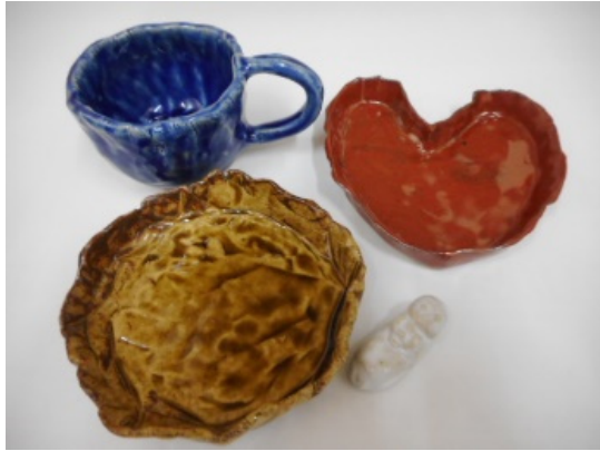
夏休みこどもの陶芸教室