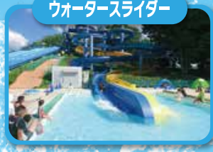
ウォータースライダー