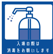
入場の際は 消毒をお願いします