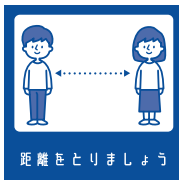
距離をとりましょう