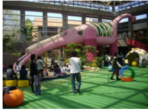
雨天でも安心♪屋内施設『こどもの城』

とちぎわんぱく公園は、日常では経験できない体験メニューなど、お子さんから大人の方まで楽しめるイベントが盛りだくさんです。また、オオムラサキの放蝶会やムシが集まる木をさがしてみようなど『自然』と『季節』を体で感じる様々なイベントを開催します。ぜひ、とちぎわんぱく公園にお越しください。