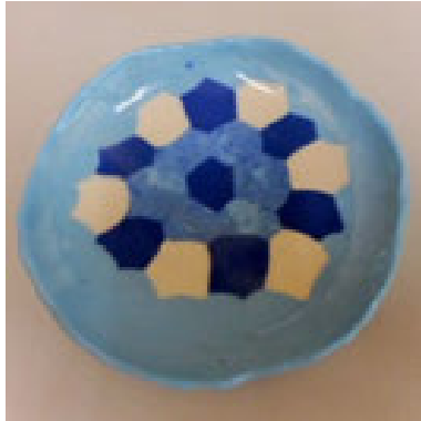
7/3 親子で『アイス皿』をつくろう