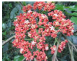
リーアコッキネア

☆7月の体験教室☆ 10:30～、13:30～ 各10名 10日(日) コケ玉づくり 1,200円 17日(日) サボテンの寄せ植え 1,500円