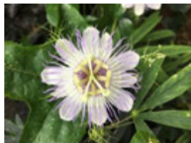
時計草レッドアップル