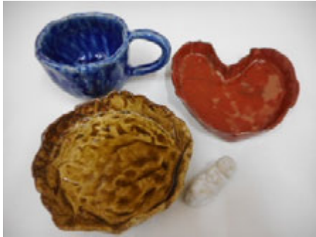
夏休み『子どもの陶芸教室』