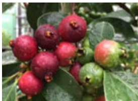
ストロベリーガバの実