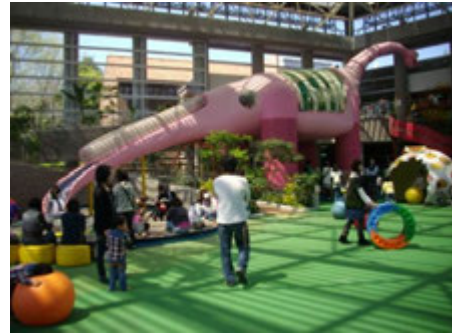
雨天でも安心♪屋内施設『こどもの城』

とちぎわんぱく公園は、日常では経験できない体験メニューなど、お子さんから大人の方まで楽しめるイベントが盛りだくさん。また、『森の自由研究』夏休みの自由研究にチャレンジ! やブルーベリーを摘もうなど『自然』と『季節』を体で感じる様々なイベントを開催。ぜひ、とちぎわんぱく公園にお越しください。