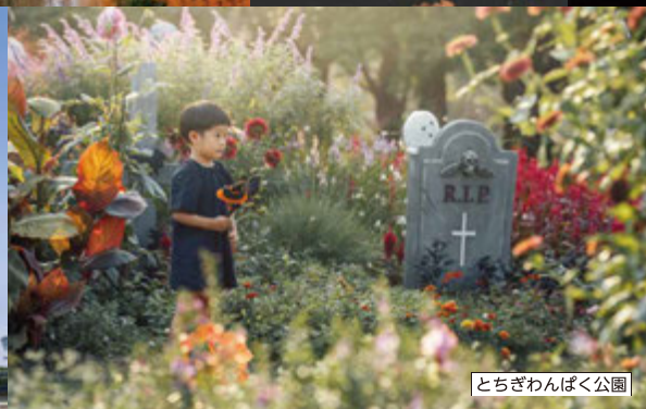
とちぎわんぱく公園