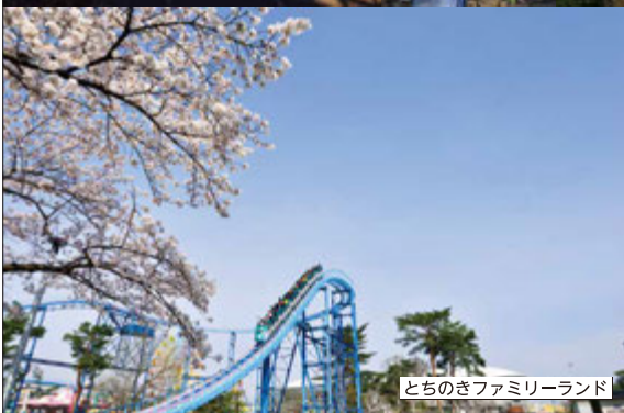
とちのきファミリーランド