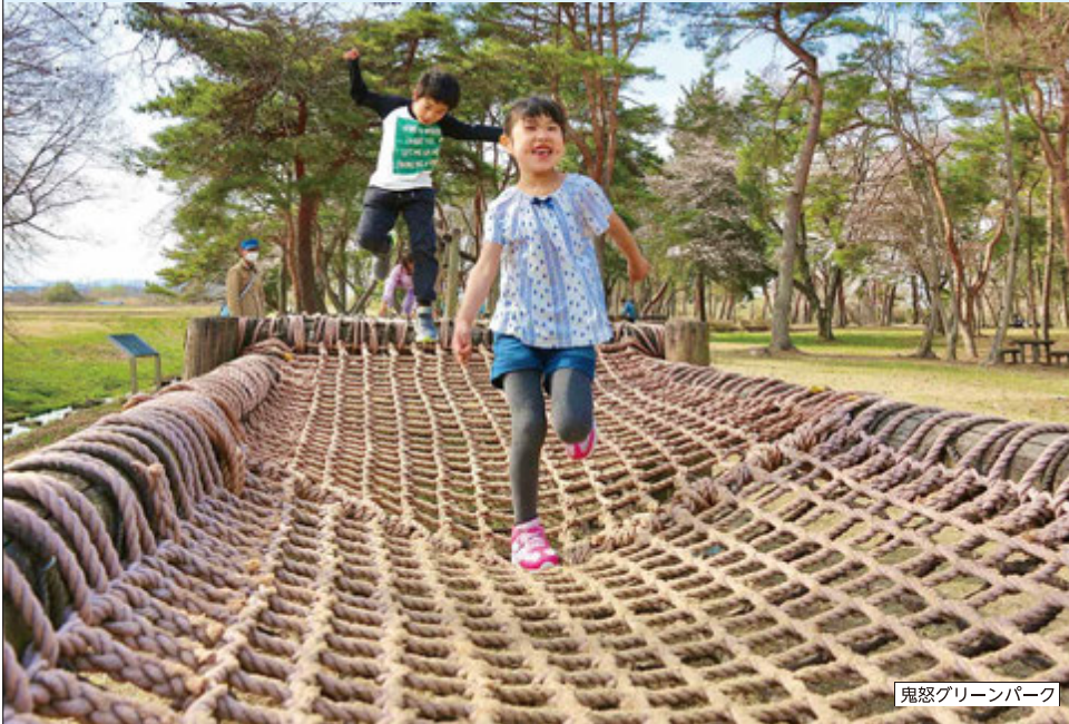
鬼怒グリーンパーク