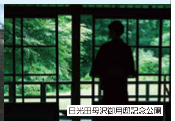
日光田母沢御用邸記念公園