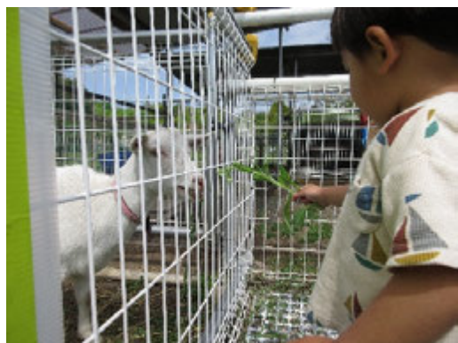
ヤギと友だちになろう！