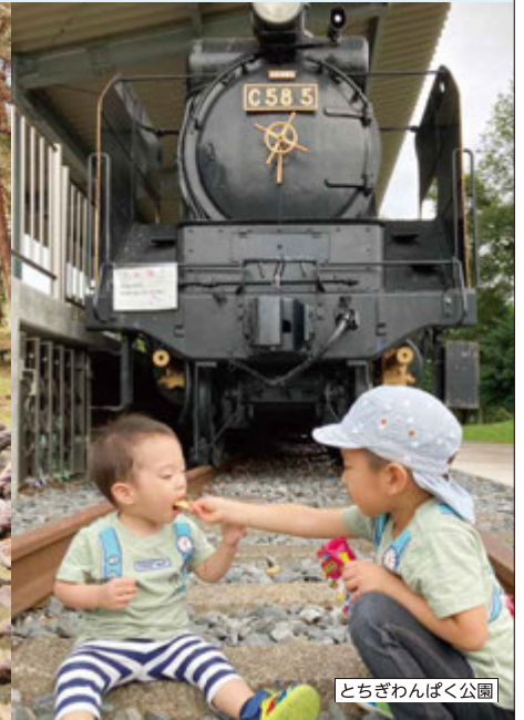
とちぎわんぱく公園

花と緑と遊びがいっぱいの栃木県営都市公園!そこで出会った素晴らしいシーンを写真に撮ろう!あなたのベストショットをお待ちしています!