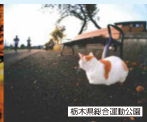
栃木県総合運動公園