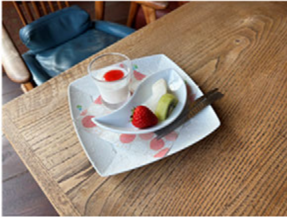
■写真：いちごを使ったデザート