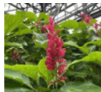
メガスケバスマエリトロクラミス