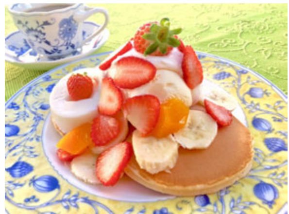
■写真：いちごみるくパンケーキ

2026年1月15日（木）から2026年3月31日（火）までの期間中、 那須塩原市内の宿泊施設、飲食店、人気のパン屋さんなど43の参画施設で「いちご」と「みるく」を使ったオリジナルスイーツをご提供。