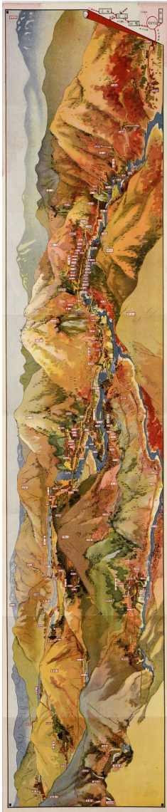
塩原温泉案内図絵