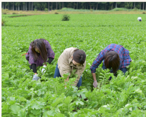
高原特有の朝晩の寒暖差で たっぷりと蓄えた甘み！