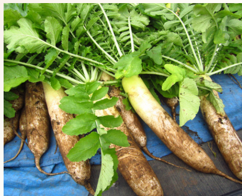
火山灰を含む水はけの良い土壌で のびのびとまっすぐ育つ！