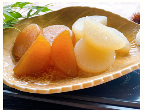
味もしっかり染み込む柔らかさ！