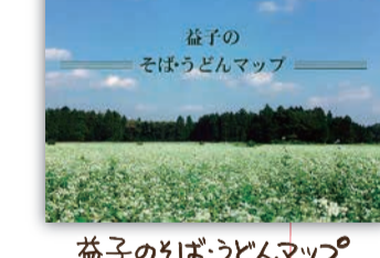
益子のそばうどんマップ